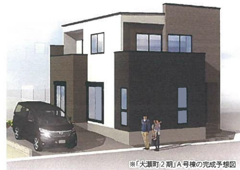
※「大瀬町2期」A号棟の完成予想図