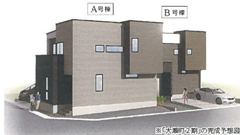
※「大瀬町2期」の完成予想図