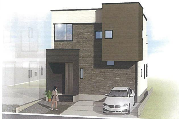
※「大瀬町2期」B号棟の完成予想図

遠州鉄道『さぎの宮』駅 徒歩12分 『さぎの宮北』バス停 徒歩2分 イオンモール浜松市野まで車4分(1.99km)はじめ、周辺商業施設が充実した住環境。