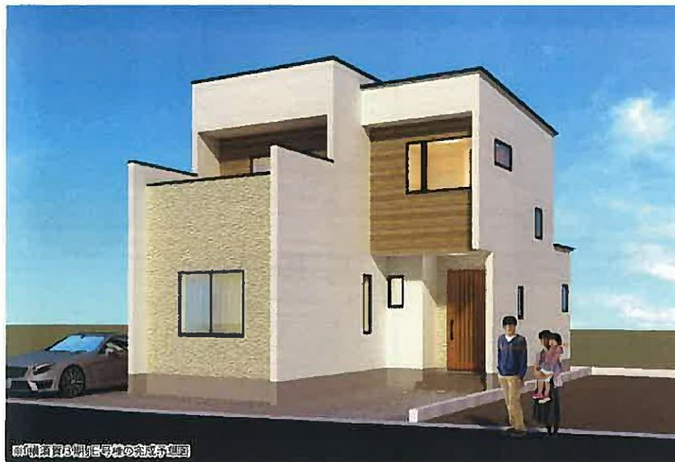
横須賀3期E号棟の完成予定図