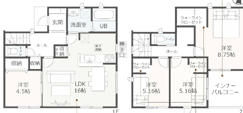
心地よい広々とした開放的なLDK。